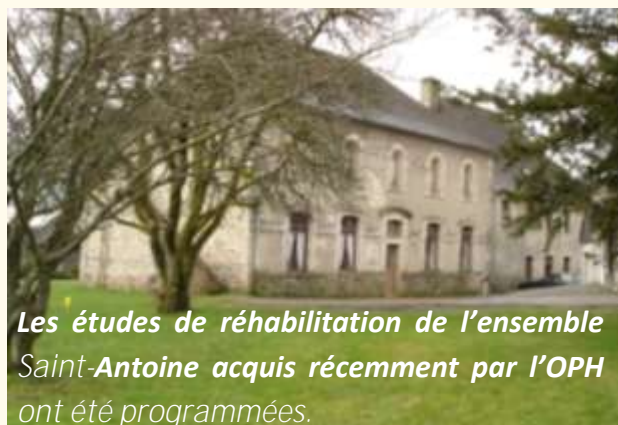
Les études de réhabilitation de l'ensemble Saint-Antoine acquis récemment par l'OPH ont été programmées.

RAPPEL : toute demande de logement social peut s'effectuer soit en venant retirer un dossier à l'Office, soit en le téléchargeant depuis le site de la mairie d'Egletons - www.mairie-egletons.fr - sous la rubrique «Office Public de l'Habitat».