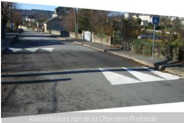
Ralentisseurs rue de la Charrière Profonde