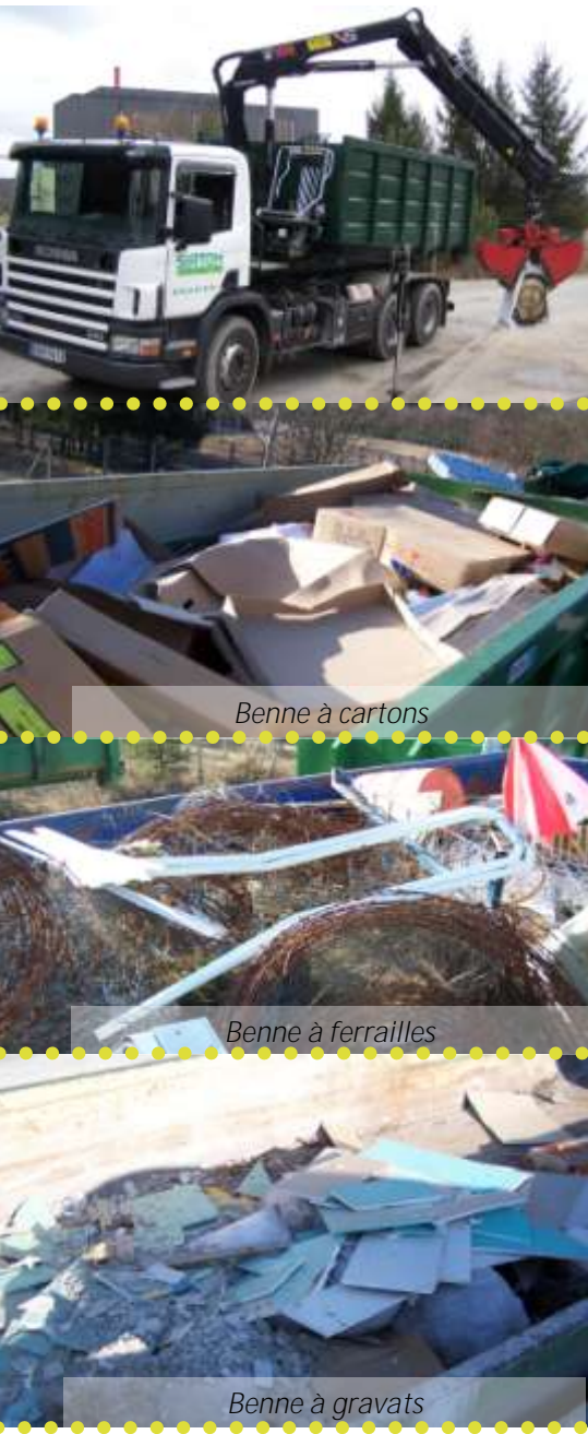
Benne à cartons