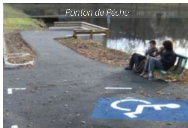
Ponton de Pêche

De même, un ponton de pêche accessible aux personnes à mobilité réduite a été aménagé à l'étang du God-Arnal en partenariat avec l'association la Gaule Egletonnaise. Le cinéma l'Esplanade fera également l'objet de quelques travaux d'accessibilité en 2010, ainsi que l'OPH du pays d'Egletons avec la construction d'une rampe d'accès menant à l'accueil.