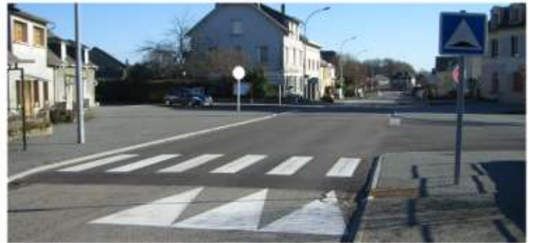
Plateau surélevé Quartier de la Gare