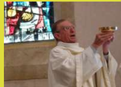
Hommage à l'Abbé Louis JOUSSEAUME