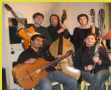
Concert JAZZ Manouche...

Bulletin d'informations municipales de la ville d'Egletons