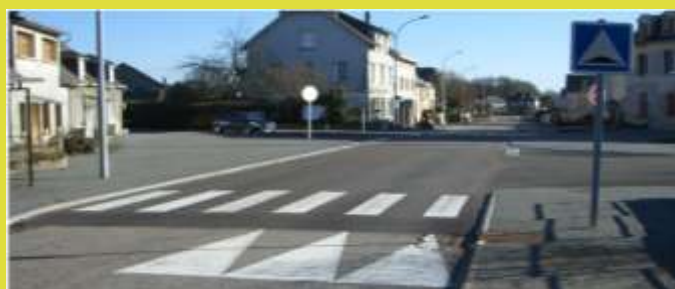
Aménagements de sécurité