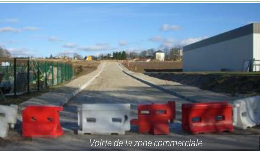
Voirie de la zone commerciale