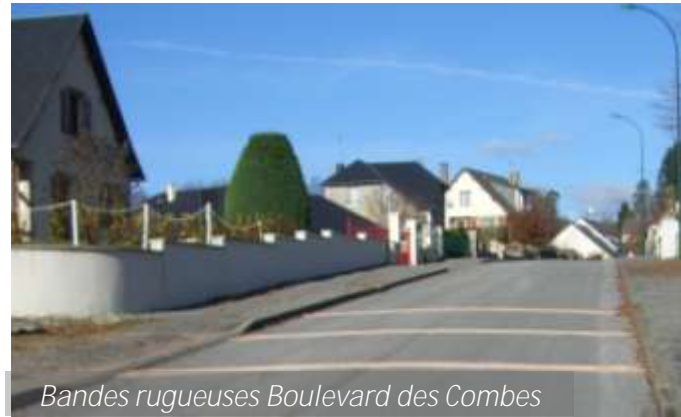
Bandes rugueuses Boulevard des Combes

D'autres rues se sont vues équipées de ralentisseurs, comme la rue de Bellevue, et le carrefour de la gare a été équipé cet été d'un ralentisseur de type plateau surélevé, à la grande satisfaction des habitants du quartier qui reconnaissent l'efficacité de ce dispositif.